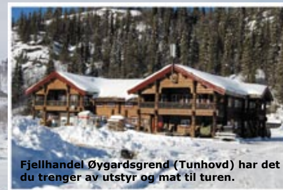
Fjellhandel Øygardsgrend (Tunhovd) har det du trenger av utstyr og mat til turen.

Bli med på isfisketur til nydelige Tunhovd og Øygardsgrend. Dette er et fantastisk område for isfiske etter ørret og røye. Områdene har lange tradisjoner for isfiske.