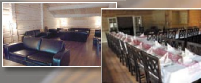
Hyggelige selskapslokaler til røyemiddagen

Lørdag ettermiddag legges det opp til tilberedning av egen fisk og fellesmiddag, i selskapslokalene til Fjellhandel Øygardsgrend.